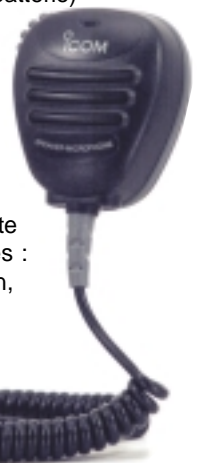
HM-138 Microphone étanche